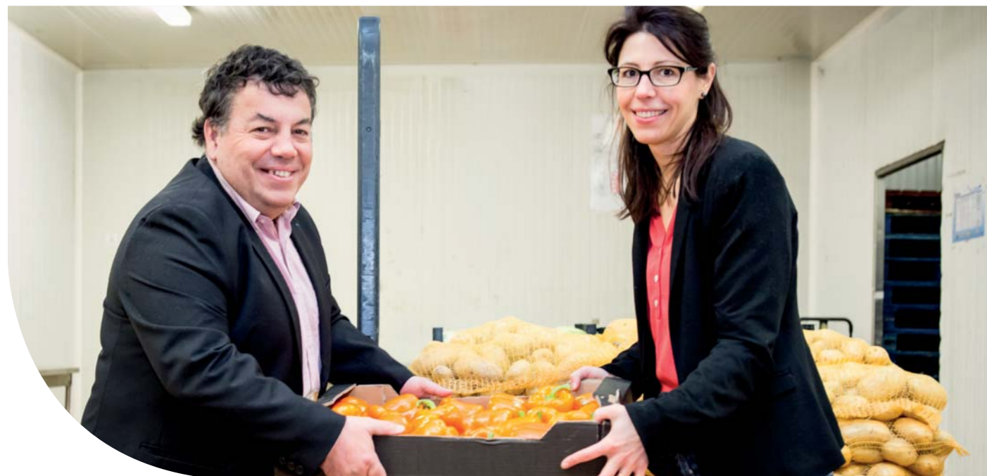
LE POTAGER DE MARIANNE Fonds de Confiance Promotion 2011 32 emplois en 2015

Vous avez un projet d'entreprise sociale ? Vous voulez accéder à un réseau d'entrepreneurs sociaux confirmés ? Vous souhaitez un regard d'expert ?